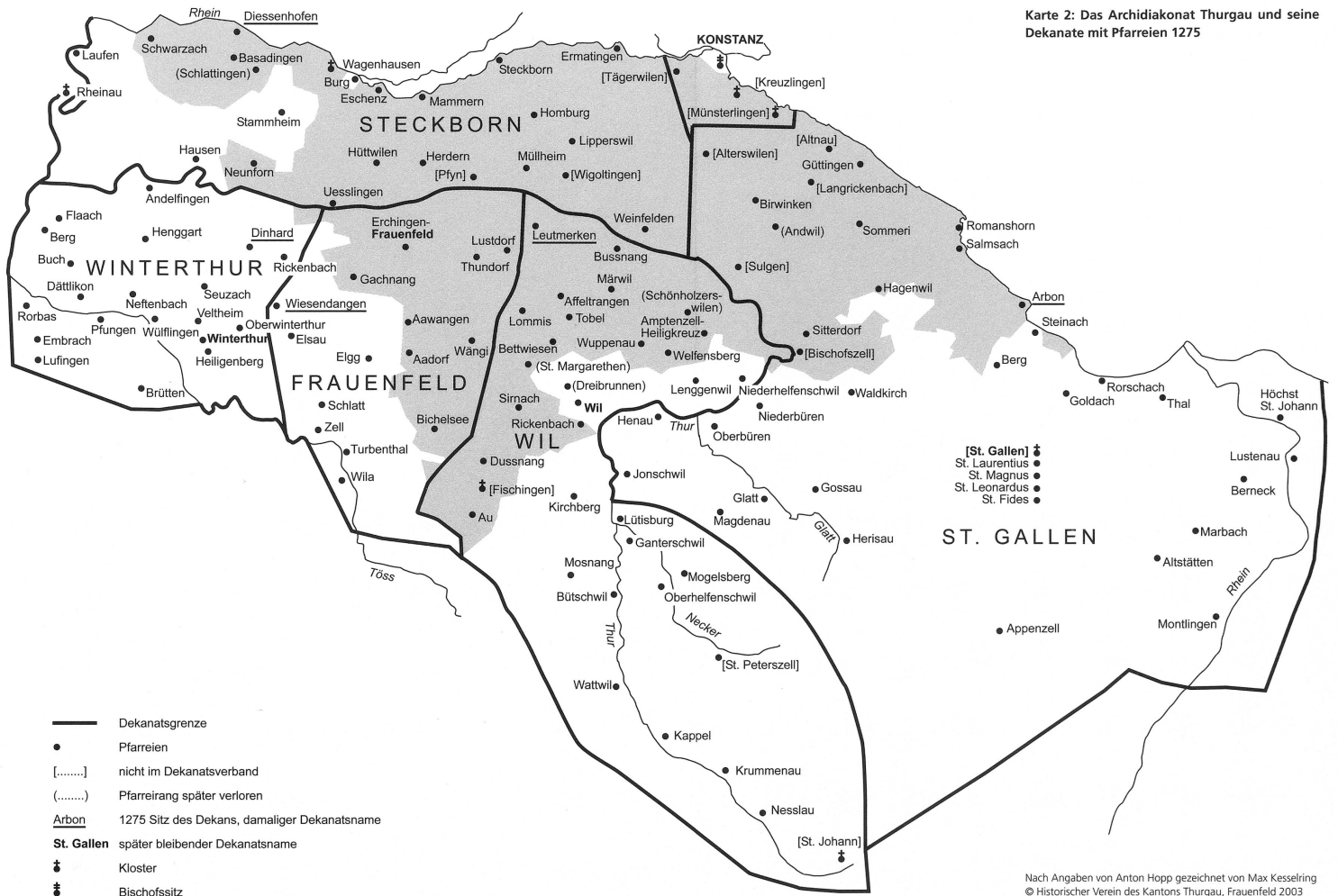
Karte 2: Das Archidiakonat Thurgau und seine Dekanate mit Pfarreien 1275