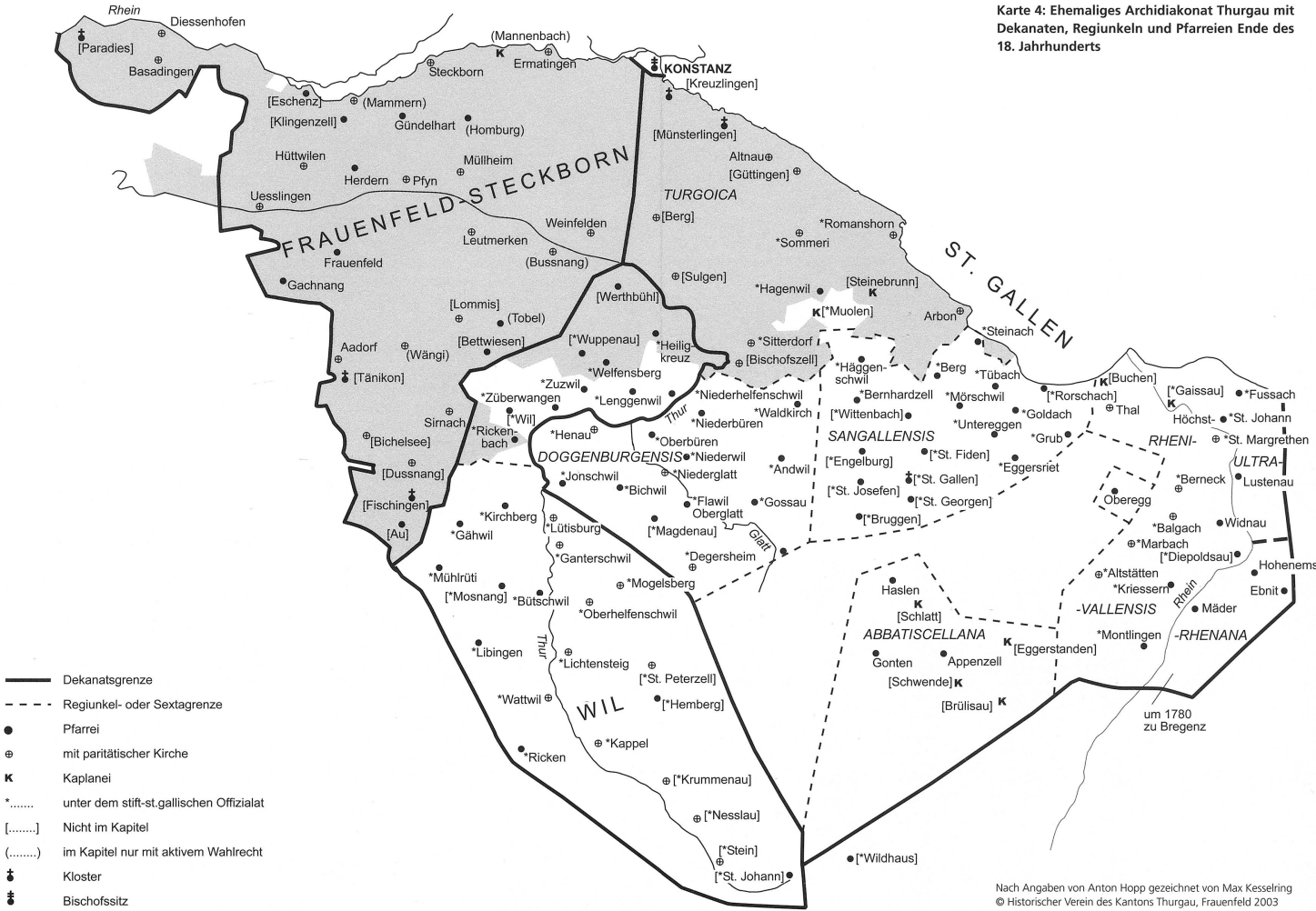
Karte 4: Ehemaliges Archidiakonats Thurgau mit Dekanaten, Regiunkeln und Pfarreien Ende des 18. Jahrhunderts