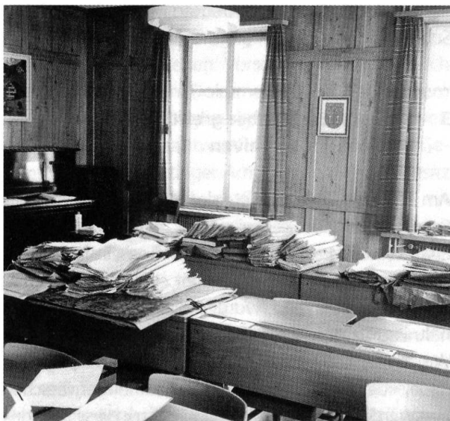
Das Archiv der Ortsgemeinde Salen-Reutenen 1977.

meln und damit zu sichern. Das Gesuch war nicht ganz uneigennützig, denn durch die geordneten und verzeichneten Archive sollte auch die historische Forschung befördert werden – ein zentrales Anliegen des jungen Vereins. Um die Regierung zu überzeugen, bediente sich der Historische Verein auch praktischer Argumente: «Viele Schriften, die nicht bloß historische sondern rechtliche & ökonomische Bedeutung für die Gemeinde haben», müssten aufbewahrt werden, denn es wären «manche kostspielige & verbitternde Prozesse der Gemeinden gegen Gemeinden & gegen Partikularen unterblieben [...], wenn die Gemeindearchive besser bekannt gewesen wären.» 15