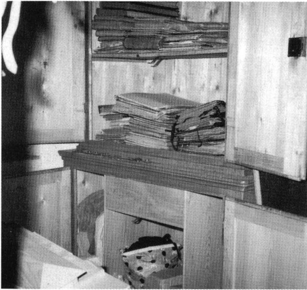
Das Archiv der Bürgergemeinde Diessenhofen 1988.

früher gemachten Vorschläge in eine andere Form gebracht und wesentlich vereinfacht» habe. 18 Auf welche Vorarbeiten hier Bezug genommen wird, lässt sich aus heutiger Sicht nicht sagen.