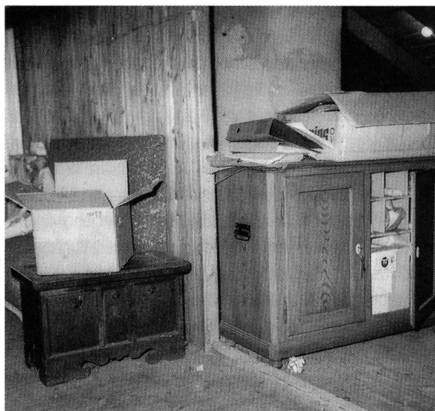
Das Archiv der Ortsgemeinde Horn 1978.