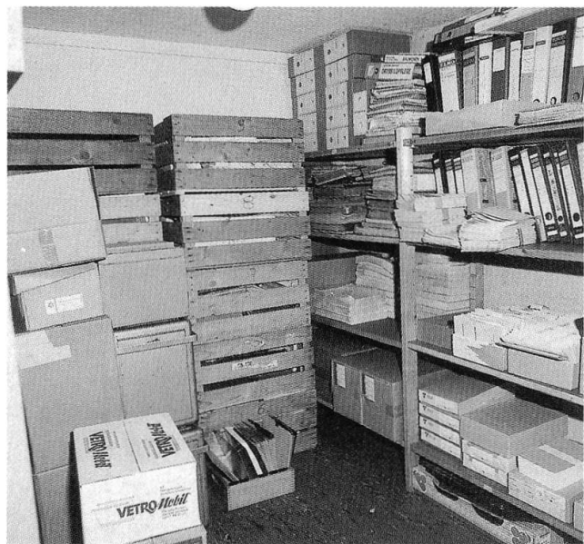
Das Archiv der Ortsgemeinde Landschlacht 1993.

dass die vorhandenen Archivalien zumindest einmal benannt wurden und in der Folge nicht mehr spurlos verschwinden konnten. Gleichzeitig diente ein Verzeichnis der Benutzung und Ausleihe von Archivalien, was ausdrücklich, jedoch «unter Anwendung der erforderlichen Vorsicht», gestattet wurde. 24