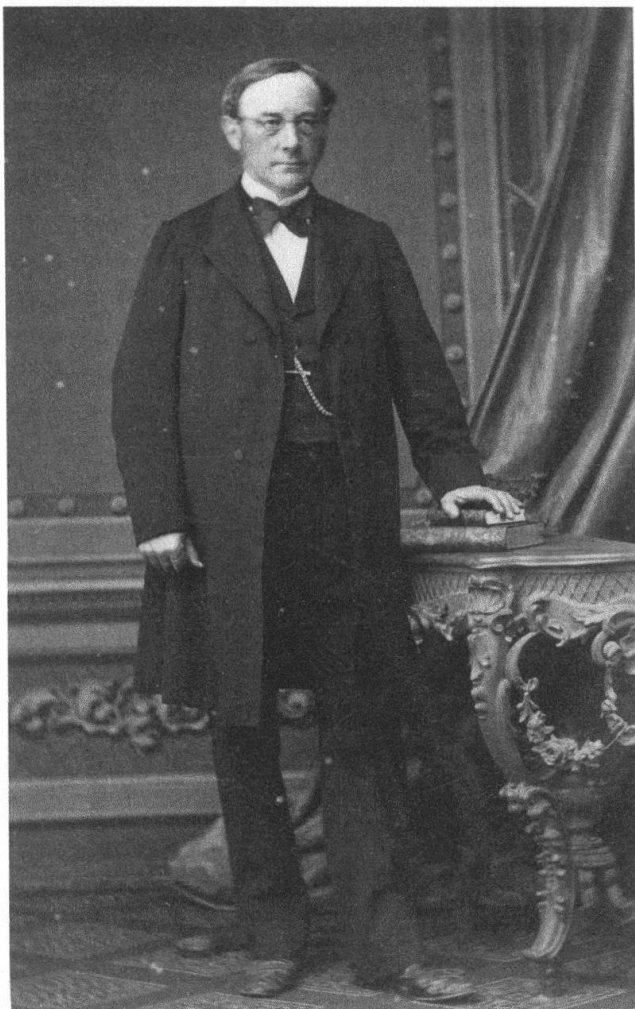
Abb. 25: Johann Konrad Kern (1808–1888) stammte aus Berlingen und startete ab 1832 eine beispiellose politische Karriere, zunächst auf kantonaler, später auf nationaler Ebene. «Minister» Kern prägte als Redaktor die Bundesverfassung von 1848 und wirkte 1857–1883 als Gesandter der Schweiz in Paris.

welche diese Sache einfädelt. Je detaillierter die eingesetzte Revisionskommission die Unterlagen studierte, desto eindeutiger wurde der Tatbestand der Unterschlagung durch Heinrich Freyenmuth. Er wurde 1852 fristlos entlassen und den Strafverfolgungsbehörden überstellt.