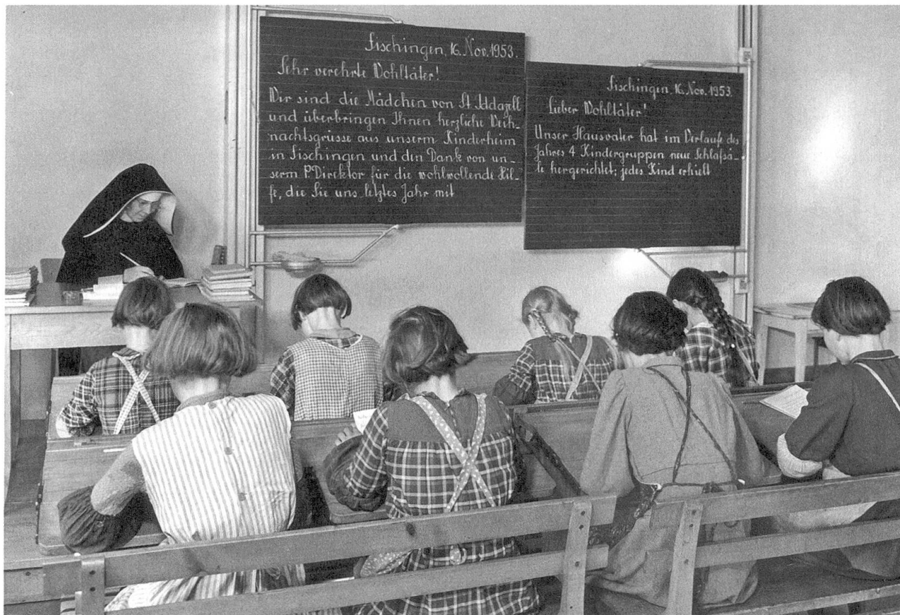
Abb. 17: St. Iddazell war stets auf Spenden angewiesen. Wie diese Aufnahme von 1953 zeigt, mussten die Schülerinnen und Schüler Bettelbriefe mit vorgegebenem Text an potenzielle «Wohltäter» verfassen.