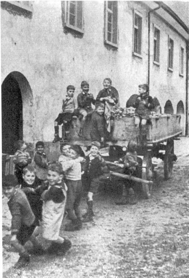
Abb. 14: Jedes Jahr im Herbst führte St. Iddazell im Thurgau eine Apfelsammlung durch, die jeweils von den Kanzeln herunter angekündigt wurde.

sen. 246 Zur finanziellen Rolle der Landwirtschaft lassen sich so kaum Schlüsse ziehen. Von 1920 bis 1936 sind beispielsweise Einkünfte aus dem Landwirtschaftsbetrieb überliefert, die wahrscheinlich die Viehwirtschaft und den Gemüseverkauf betreffen. Aus diesen Zahlen lässt sich schliessen, dass in dieser Zeit die Landwirtschaft einen wichtigen Bestandteil mit bis zu 33,6 Prozent (1920) der Einnahmen ausmachte. 247 Aus den folgenden Jahren sind keine solchen Zahlen überliefert. Die Einkünfte aus den Viehverkäufen hingegen lassen sich eher rekonstruieren. Sie machten bis zu 6 Prozent (1900) des Einkommens der Anstalt aus, 1940 waren es immerhin noch 4,3 Prozent oder rund 2174 Franken.