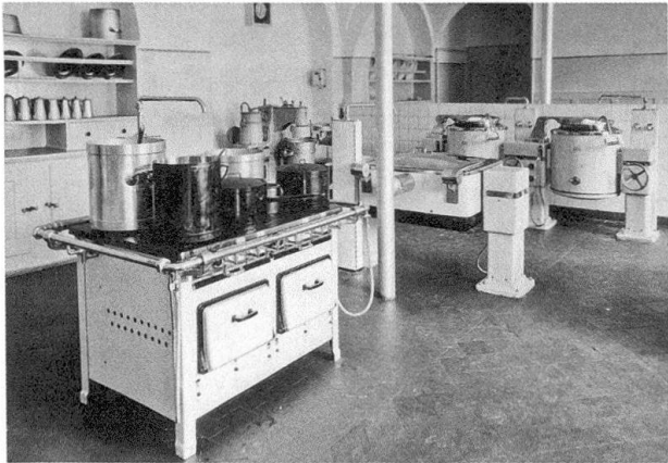
Abb. 15: Als 1940 die Küche renoviert werden musste, wurde die weltweit erste Holzgas-Grossküchenanlage eingerichtet, um «das Holz des eigenen Betriebes in ausgiebigster und billigster Art zu verwenden». Die unangereifte Anlage war indes pannen anfällig und verursachte beim Küchenpersonal Kopfweh, so dass sie nach nur sieben Jahren ersetzt werden musste.

in den Orden und den gewandelten Anforderungen an Kinderheime stellte St. Iddazell seit den 1960er-Jahren jedoch vermehrt weltliches Personal ein, was den steilen Anstieg der Lohnkosten in dieser Zeit erklärt.