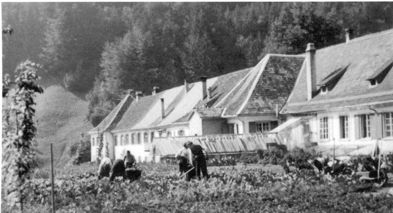
Abb. 13: Auf den Tisch in St. Iddazell kam hauptsächlich Gemüse aus der eigenen Gärtnerei. In der Aufnahme von 1939 sind Personen bei der Arbeit und das Treibhaus vor dem alten Wirtschaftsstrakt zu sehen. Zur Anstalt gehörten weitere Betriebe, die durch Verkauf der Produkte zum Unterhalt sowie zur Selbstversorgung beitrugen. Neben landwirtschaftlichen Produkten wie Milch war dies vor allem auch Holz aus den anstaltseigenen Wäldern.

nannte Schwererziehbare, was für die Neuausrichtung des Kinderheims St. Iddazell in den 1960er-Jahren mitentscheidend gewesen sein dürfte. 243