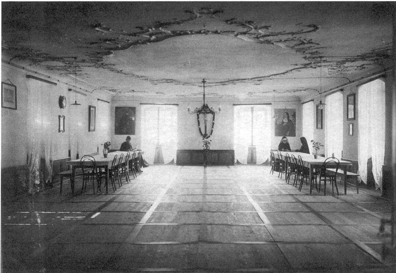
Abb. 22: Diese undatierte Aufnahme scheint auf der Bildebene zu bekräftigen, dass man sich nicht viel zu sagen hatte. Im gemeinsamen Aufenthaltsraum sitzen Patres und Schwestern getrennt an zwei Tischen, die kaum weiter auseinander stehen könnten.

allem nichts, deshalb sei eine Unordnung im Speisesaal. Auf das hin versuchte ich beiden verständlich zu machen, dass es für mich keinen Zweck habe, etwas zu sagen, solange sie im Schweigen und Gehorchen nicht anders als die Kinder selbst seien. [...] Wenn sie selbst unbeherr[s]cht sind und ständig auf die Kinder losschwatzen und schimpfen, reizt das jedes zum Widerspruch. Ordnete ich etwas an und wurde es von den Sr. nicht ausgeführt, so war meine Mühe umsonst.» 308