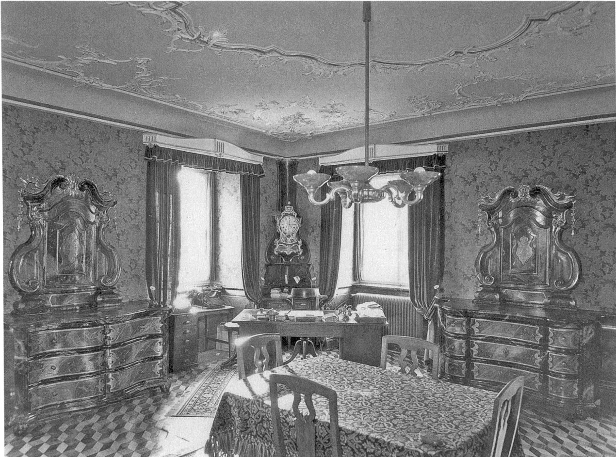
Abb. 18: In dem mit einem dekorativen Parkettboden, einer kunstvoll gestalteten Rokoko-Stuckdecke, auserlesenen Tapeten, wertvollem Mobiliar und einer grossen Pendule ausgestatteten Prunkzimmer im ersten Stock in der Südwestecke weisen nur die beiden Schreibtische und die Schreibmaschine darauf hin, dass es sich um das Büro des Direktors handelt.

gen als auch die Kompetenzenregelung mit den Menzinger Schwestern allein in den Händen des Direktors. 280 Die bereits in den Gründungsstatuten festgeschriebene Machtfülle des Direktors blieb erhalten, ja wurde mit dem «absoluten Rechte der Befehlsgebung» im Vertrag von 1920 sogar noch verstärkt. 281 Die Menzinger Schwestern hingegen blieben in diesen Statuten unerwähnt, ebenso die Festlegung und Handhabung der Hausordnung.