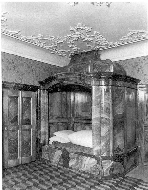
Abb. 19 und 20: Das hierarchische Gefälle im Heim manifestierte sich auch in den unterschiedlichen Schlafgelegenheiten. Während der Direktor in einem prunkvollen Himmelbett nächtigte (Abb. 19), verbrachten die Erzieherinnen die Nacht in einem kastenartigen Verschlag im Schlafsaal der Kinder (Abb. 20).

Menzingen von 1920 Auskunft gibt: Einzig in die «Angelegenheiten des Ordenslebens der Schwestern» durfte er sich nicht einmischen. 290 Den Schwestern wurden im Vertrag «ihrem Stande angemessene möblierte Wohngelegenheiten, ferner genügende und kräftige Kost, Licht, Heizung, Wäsche und eine jährliche Barentschädigung von Fr. 300» zugesichert. 291 Weiter hatten sie Anrecht auf genügend Zeit zur «freien und ungehinderten Verrichtung ihrer vorgeschriebenen Andachtsübungen». 292 Auch von einer jährlichen Erholungszeit im Rahmen von 8 bis 14 Tagen war die Rede, die den Schwestern «wenn nötig» gestattet werden sollte. 293