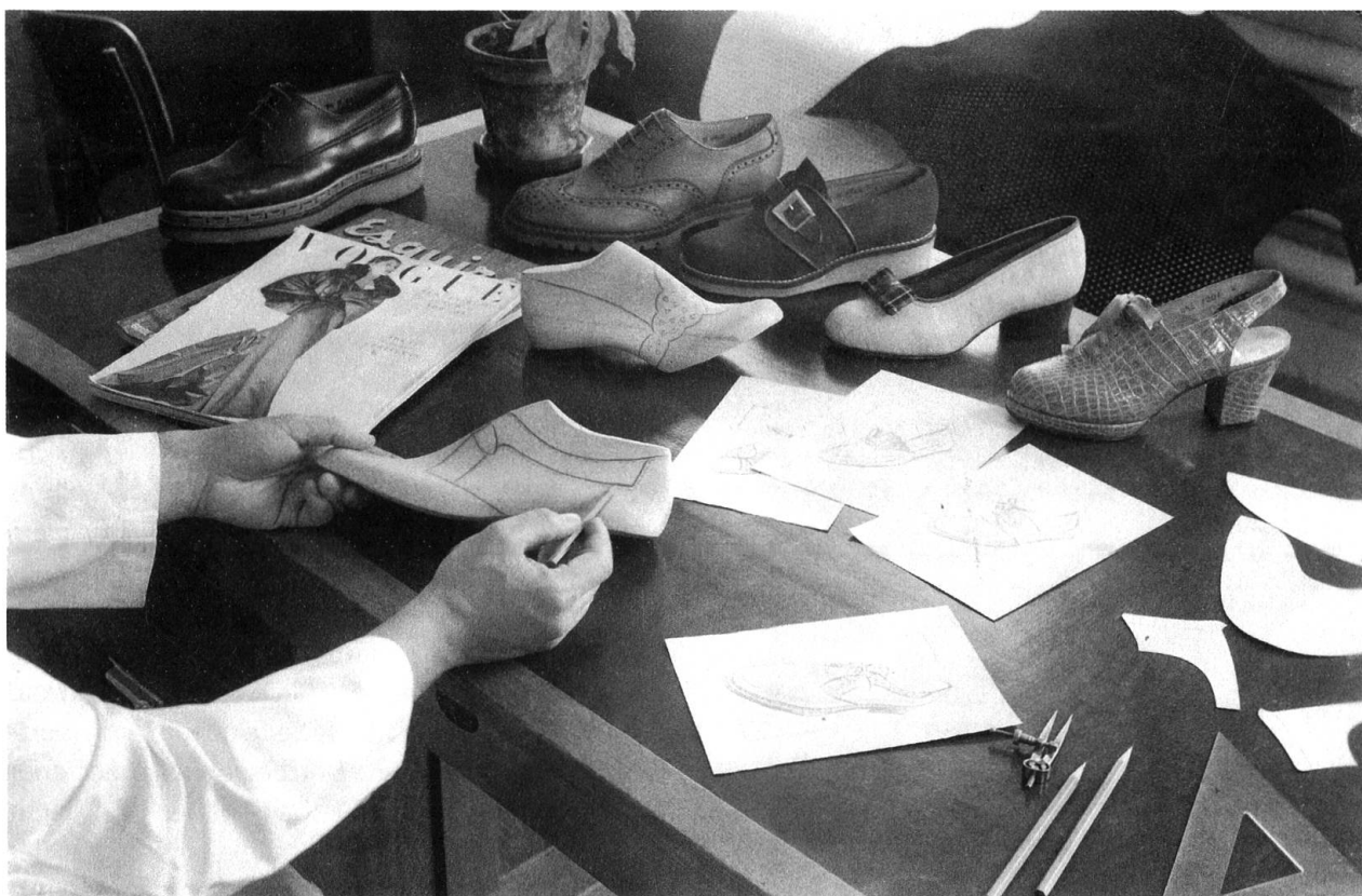
Abb. 5: Der Créateur bei der Arbeit.

schichten mit einem Rahmenband zusammengenäht werden. Heute gibt es weltweit nur noch wenige Hersteller von Rahmenschuhen. Der letzte der Schweiz, die Schuhfabrik Elgg, stellte die Produktion 2002 ein. 143