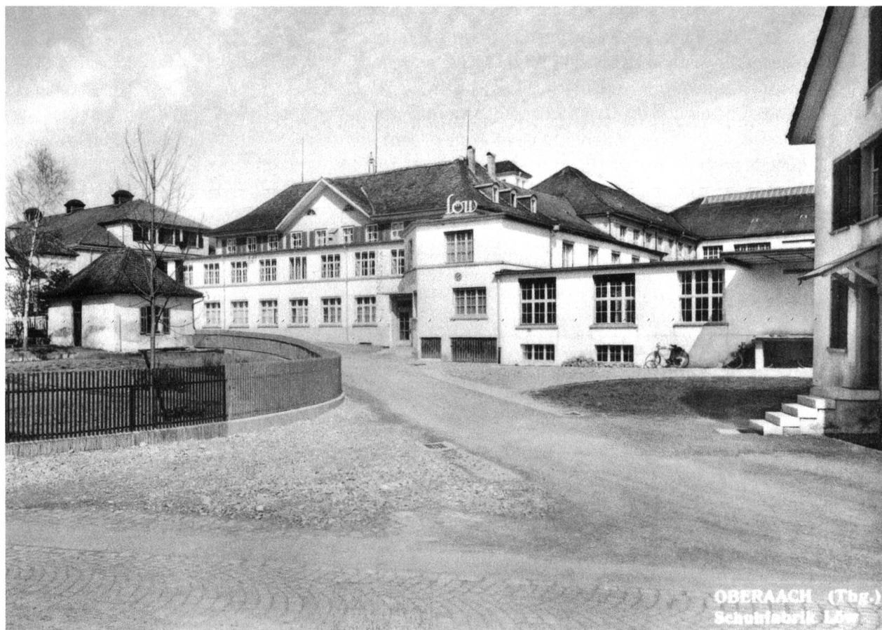
Abb. 1: Einfahrt zur Schuhfabrik Löw in Oberaach, wo am 14. März 1951 drei Wagen mit der Untersuchungskommission vorfuhren. Ansichtskarte von 1948.