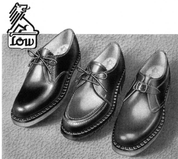
Abb. 7: Das Inserat in der Amriswiler Schreibmappe von 1951 listet die Verkaufsläden der Firma Löw auf. Allein in Zürich bestanden drei Filialen an bester Lage.