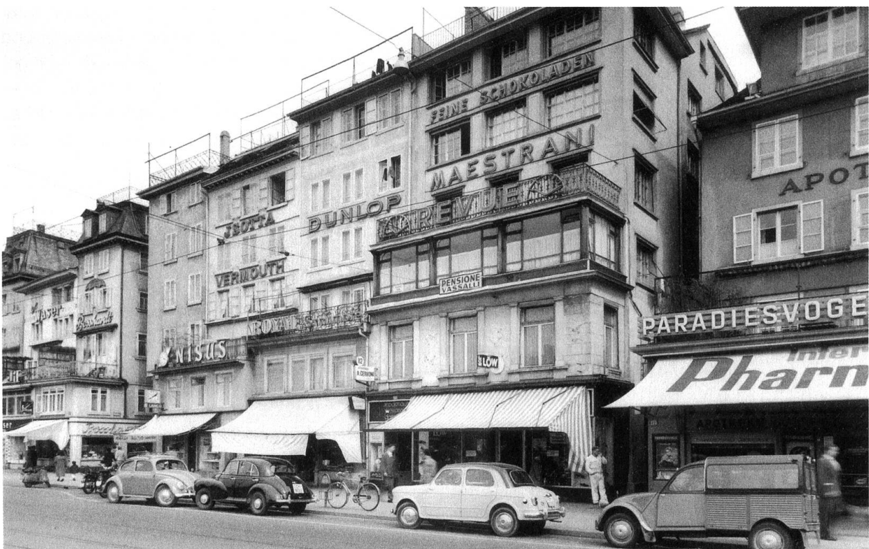
Abb. 10: Filiale von Löw am Limmatquai 112 in Zürich. Aufnahme von 1956.

Die Löw-Gerberei, die vor dem Krieg durchschnittlich 40 Prozent ihrer Bodenleder-Produktion an andere schweizerische Schuhfabriken verkauft hatte, belieferte diese kaum noch während des Kriegs, als Leder knapp war. Ab 1948/49 hatte dies Auswirkungen, denn die fremden Schuhfabriken wollten das Leder aus Oberaach nicht mehr. 171 Nur die Korea-Krise von 1950 brachte eine kurze Änderung. Doch wollten die Schuhfabriken infolge des Preiskampfes hauptsächlich billige Leder und geringere Qualität, als Oberaach anbieten konnte. Sie setzten auch auf Gummisohlen und anderes Lederersatzmaterial. Die Oberleder-Gerberei wurde im Krieg wieder in Betrieb genommen, arbeitete aber mit Verlust.