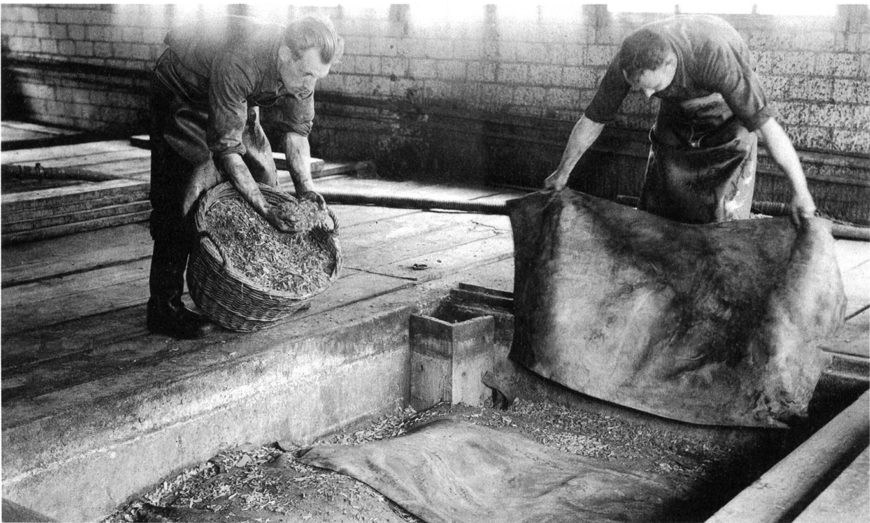
Abb. 8: Zwei Gerber der Firma Löw streuen Eichen- und Fichtenrinde zwischen die Häute.