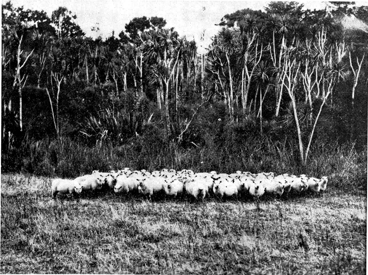
Subtropische Schaflandschaft auf der Nordinsel Neuseelands Ein ungewöhnlicher Anblick: Schafe unter Palmen und Farnbäumen

hauptsächlich in den Hochgebirgen der Südinsel mit den kargen Weiden gut bewähren, spielen daneben eine relativ kleine Rolle.