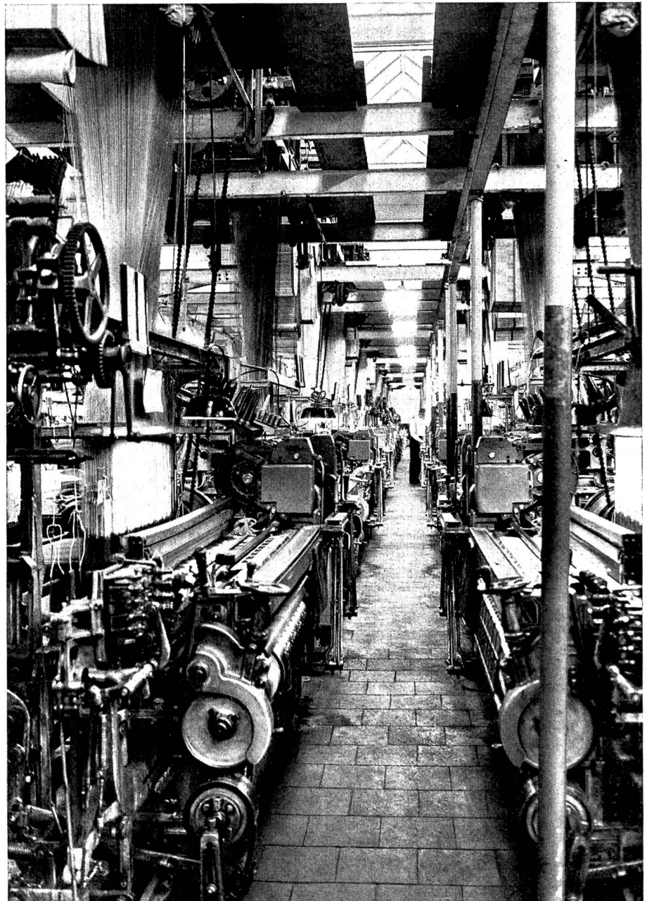
Automatisierte JAEGGLI- Seidenwebstühle, Baujahr 1935, in einer Seidenweberei im Rheinland