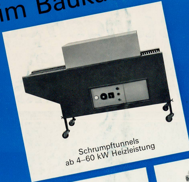
Schrumpftunnels ab 4-60 kW Heizleistung

Planen Sie in Ihrem Betrieb mit Kalfass-Verpackungsmaschinen im Baukasten-System.