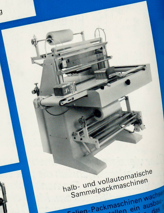
halb- und vollautomatische Sammelpackmaschinen