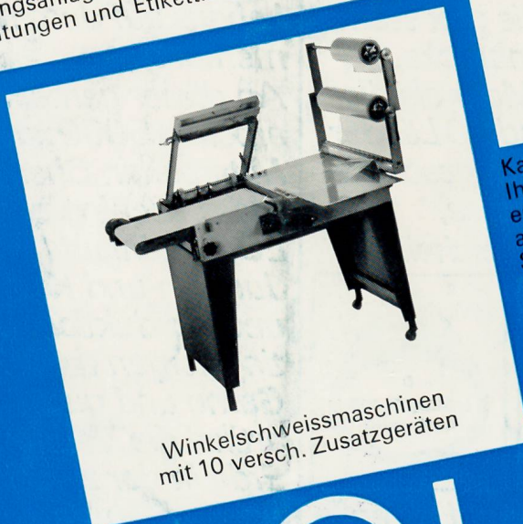
Winkelschweissmaschinen mit 10 versch. Zusatzgeräten

Kalfass-Folien-Packmaschinen wachsen Ihrem Betrieb. Sie stellen ein ausbau- ergänzungsfähiges System dar, das auf Jahre hinaus Beweglichkeit garantiert. Selbst das einfachste Grundmodell lässt nachträglich zum Halb- oder Vollauto- ausbauen. Dies gilt auch für die neueren Modelle mit Allseitenschweissung. Auf Wunsch liefern wir besondere Zuführ- und Schickungs-Einheiten sowie Spezial- führungen für Nassbetriebe. Bitte geben uns Ihre Wünsche bekannt.