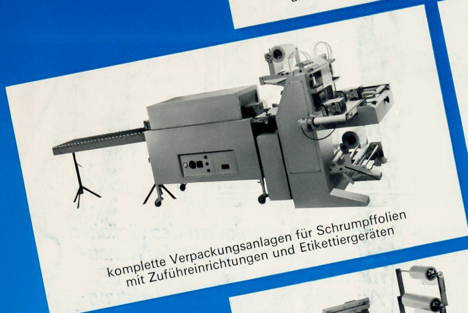
komplette Verpackungsanlagen für Schrumpffolien mit Zuführeinrichtungen und Etikettiergeräten