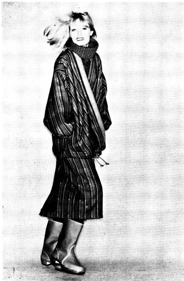
Ein Kostüm mit neuen Proportionen — entworfen von Issey Miyake. Die lange und sehr blusige Jacke mit tief angesetzten und geräumigen Aermel wird im Vorderteil schräg übereinander geschlossen und in Hüfthöhe durch ein Kordelband eingehalten. Dazu wird ein schmaler Wickelrock getragen. Das Material ist ein rot kariertes Double-face aus reiner Schurwolle mit senfarbener Abseite. Modell: Issey Miyake; Foto: Wollsiegel-Dienst.

Naturtöne (von Beige bis Dunkelbraun), Gewürzfarben (Senf und Muskat, Pfeffer und Zimt, Curry und Paprika) und Metallnuancen (Gold, Kupfer, Messing, Stahl und Rost) stehen im Vordergrund. Sie werden — ebenso wie Schwarz und Ecru — mit warmen, leuchtenden