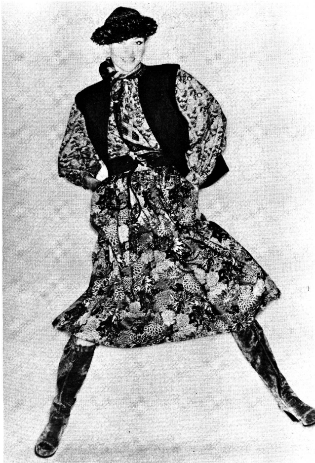
Yves St. Laurent wählte zwei verschieden bedruckte Chaly-Gewebe aus reiner Schurwolle für Rock und Bluse. Die Farben: rostiges Orange, Grau- und Brauntöne. Dazu wird eine Bolero-Jacke mit kontrastierenden Blenden getragen. Modell: Saint Laurent rive gauche; Foto: Wollsiegel-Dienst.

Der Hosenmantel im Parka-Stil mit Reissverschluss aus federleichten Schurwoll-Double, aus breitgeripptem Cordsamt und gestepptem Popeline hat immer eine «Woll-Seele» — nämlich ein wärmendes Futter, uni oder schottisch kariert. Geräumige Grobstrickmäntel in leuchtendem Farbenspiel (Inka-Folklore) machen bei Dorothe Bis Furore, während St. Laurent für seine Kosakenmäntel