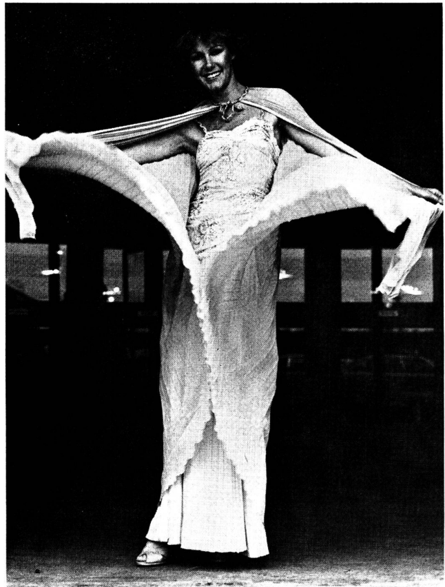
Ravissante Robe de soir — Ein elegantes Abendkleid en Polyester georgette. Modèle: Mariano, Paris; Tissu: Weisbrod-Zürcher AG, Hausen a/Albis/Suisse; Photo: Peter Kopp, Zürich.

mit schmalen Oberteil, betonter Taille und weitem Rock kostbare Schurwoll-Tuche bevorzugt. Ebenso Chloé: an Hemdärmeln markieren schmale Schurwoll-Schals, die in Hüfthöhe durch Schlitze gefädelt werden, die vertiefte Taille.