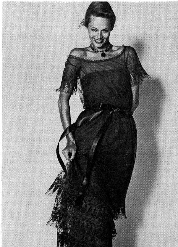
Kleid aus Baumwolltüll mit feinen Guipure-Applikationen. Modell: Dior, Paris; Stickerei: Forster Willi, St. Gallen.

Das schicke Tailleur-Ensemble war Star bei Yves Saint Laurent, er zeigte es in allen Variationen (auch mit Hosen, aber weniger als das letzte Mal), und auch in der Kombination mit Edelsteinfarben wie Rubin, Amethyst, Smaragd, Topas, die in den verwendeten Seiden-