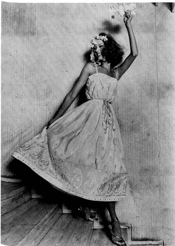
Mehrfarbig bestickter Seidenkrepp. Modell: Carven, Paris; Stickerei: A. Naef, Flawil (St. Galler Stickerei).

kostüm in Tweed und Flanell, als Warmcoat darüber eine betont breitschultrige Kastenjacke mit hohem Steppkragen, deren T-Silhouette typisch für die neuen echten Mäntel ist, von jupelang über den dreiviertellangen Paletot bis zur Cabanjacke. Eine dieser neuen markanten Jacken aus Schweizer Alcantara smocké in Beige machte Aufsehen bei Balmain.