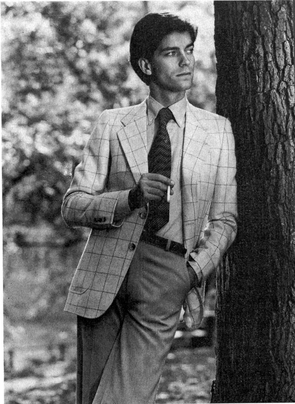
Naturfarbener «Country-Look»-Sakko aus leichtem Wollsiegel-Fresco mit blauem Fadenkaro. Grosse, aufgesetzte Taschen, leicht fallende Revers und Hornknöpfe geben ihm eine sportliche Note. Wollsiegel-Modell: Philipp; Krawatte: Alpi; Foto: Wollsiegel-Dienst/Stock.

Bevorzugt werden für den sommerlichen «Country-Look» dezente Kleinmusterungen und Strukturen in Waffelloptik sowie alle Arten von Karos — Gitter-, Block- oder klassische Glencheck-Karos — die jedoch immer harte Kontraste scheuen.