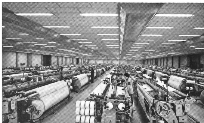
Abbildung 7 Blick in den konventionell klimatisierten Websaal T4 mit 204 Sulzer-Einfarbenwebmaschinen mit Exzentermaschine in Nennbreiten von 85'' (216 cm), 130'' (330 cm) und 153'' (389 cm). An der Websaaldecke: die perforierten Zuluftkanäle.