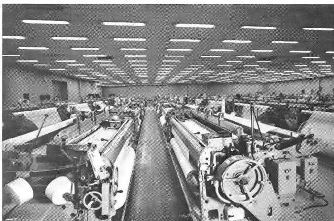
Abbildung 8 Der nach dem Condifil-Prinzip klimatisierte Websaal T5 mit 96 Sulzer-Einfarbenwebmaschinen mit Exzentermaschine in Nennbreiten von 130'' (330 cm) und 153'' (389 cm). Die Abluft wird über die Oeffnungen in der Websaaldecke abgesaugt.

tions- und Betriebskosten als auch der Nutzeffekte und damit der Webkosten. Auch der Staubgehalt der Raumluft, mit Millipore-Doppel-Membranfiltern mit 0,8 µm Porenweite beim Schusswerk im Webergang 1,6 m über dem Boden bei Aussen-/Umluftbetrieb gemessen und gravimetrisch ausgewertet, ist mit 1,7 mg/m 3 erheblich geringer als im konventionell klimatisierten Websaal mit 4,3 mg/m 3 , wobei zu erwähnen ist, dass beide Werte weit unter dem in verschiedenen Ländern vom Gesetzgeber für Baumwollwebereien als zulässig erachteten MAK-Wert (MAK = Maximale Arbeitsplatz-Konzentration) liegen.