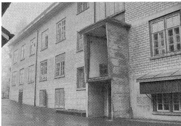
Teilansicht des Hauptgebäudes am Firmensitz