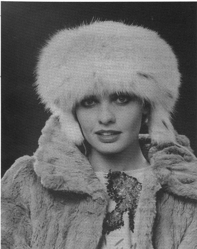
Auf Luchs eingefärbte Shadowfuchs-Toque mit Kopfplatte aus Angora-Jersey. Die ausklappbaren Ohrenpatten aus Fellklauen können unter dem Kinn gebunden werden.