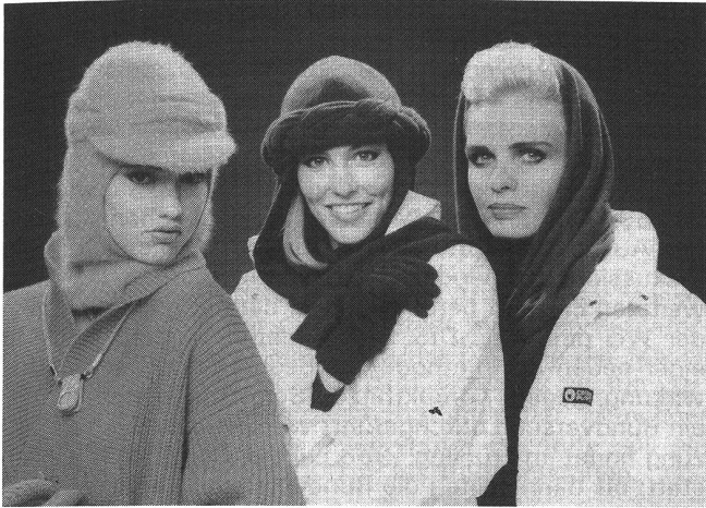
Links: Cagoule als Unterform. Darüber drapiertes Stirnband mit Schild. Mitte: Schaltuch mit Kragen. Darüber Zopfstirnband. Rechts: Grosszügiges Schaltuch mit Kragen. Alle Modelle Angora-Jersey (farblich assortiert)