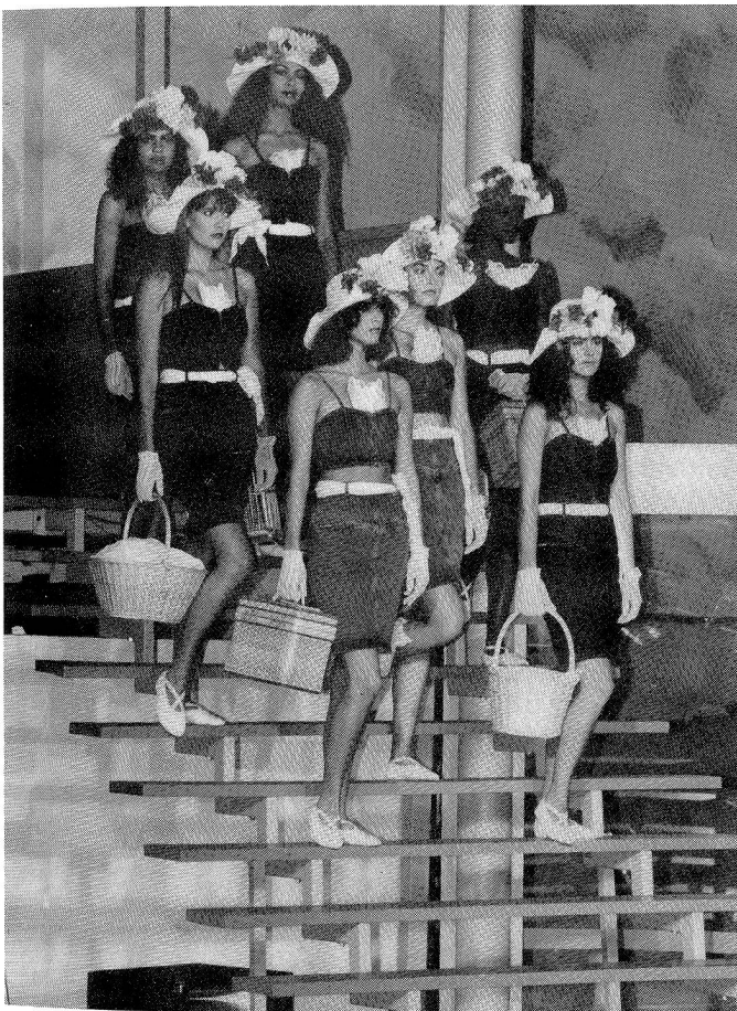
Szenenbild aus der rasanten und kurzweiligen Inter Jeans-Modenschau.