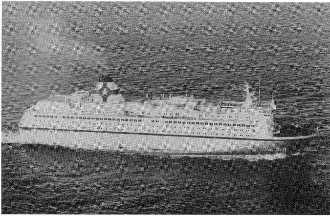
Das neue Fährschiff «Kronprins Harald», ausgerüstet mit Temperatur-Regelsystemen von Landis & Gyr, auf seiner Jungfernfahrt zwischen Kiel und Oslo.

Zwischen Kiel und Oslo werden durch die Schiffe dieser Gesellschaft täglich bis zu 2300 Passagiere und 1300 Pkws befördert.