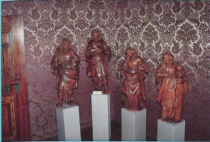
Geschnitzte Heiligenfiguren im Feuerpalast. Zu beachten ist die wundervolle, seidene Wandbespannung.

sich immer. Des Museums, der schönen Textilien, der Landschaft, und nicht zuletzt der freundlichen Glarner wegen.