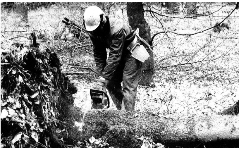
Textilien schützen Waldarbeiter vor schweren Verletzungen. Erreicht wird das mit einem Kniff. Die Arbeitsanzüge werden mit einer Schnittschutzeinlage ausgestattet, die aus mehreren Schichten langer Fäden besteht.

die in mehreren Schichten übereinander liegen. Rutscht einem Arbeiter die Motorsäge aus und reißt die Schutzkleidung auf, wickeln sich diese Fäden in die Kette der Säge. Das Gerät bleibt stehen.