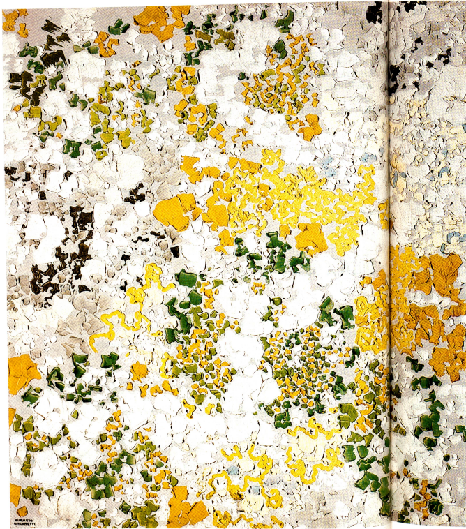
Augusto Giacometti: Eine Besteigung des Piz Duan Öl auf Leinwand, 84,5x 84 cm Sammlung Kunsthaus Zürich

Sulzer Rütli, Schweiz, Pionier auf dem Gebiet der Webtechnik, stellt Schweizer Künstler vor: