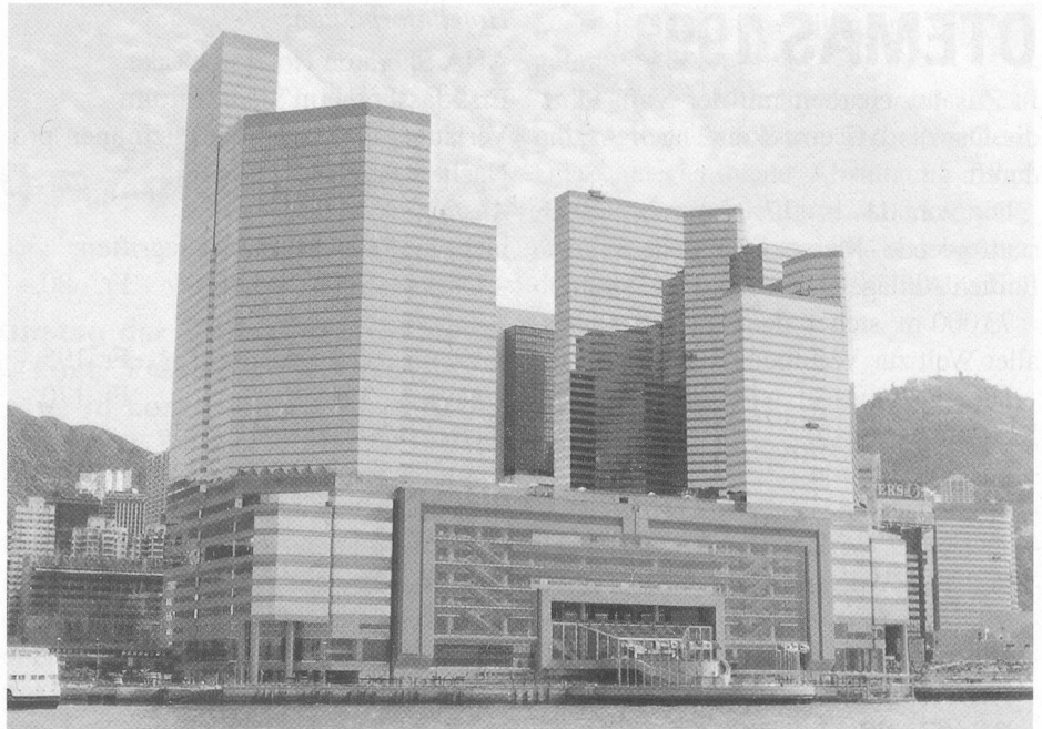
Gesamtansicht des Convention and Exhibition Centre. Das New World Harbour View Hotel ist der vordere Turm auf der linken Seite.

Mittagessen in einem chinesischen Restaurant.