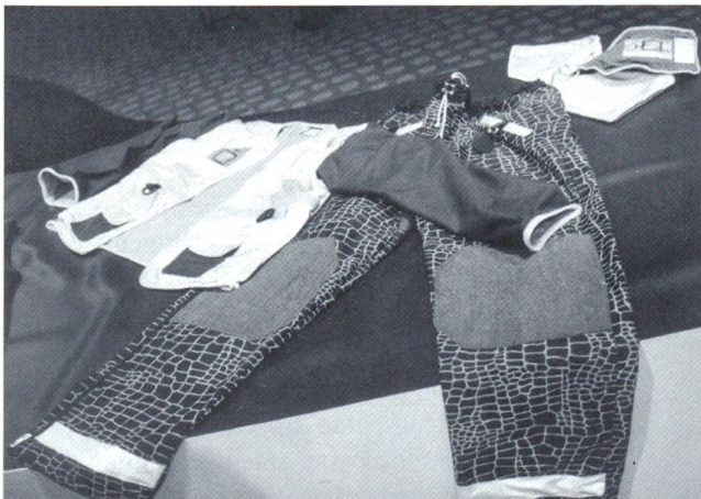
Forum «Future», Gewebe von Schoeller Switzerland

Das Forum «General» gliedert sich in die fünf Modesegmente Damen, Herren, Kinder, Verfremdungen und wird