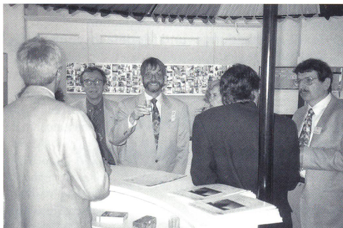
An der SVT-Bar standen «erfahrene Hasen» für die Mitglieder gewinnbereit