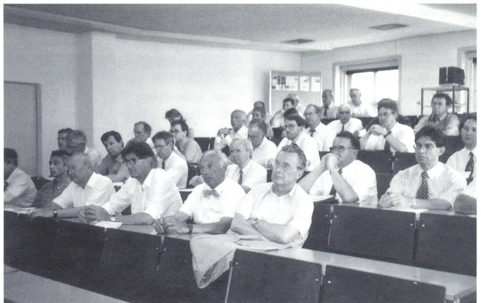
24. GV der STF

Kooperationen funktionieren folglich nur dort, wo persönliche Beziehungen zwischen den Partnern bestehen. Dies wird durch die Neueinführung eines internationalen «Textil-Management-Seminars» deutlich. Dieses Seminar wird gemeinsam von der Schweizerischen Textil-, Bekleidungs- und Modefachschule Wattwil (CH), dem Institut für Textil- und Verfahrenstechnik Denkendorf (D) und der Universität St. Gallen (CH) organisiert und durchgeführt. RS