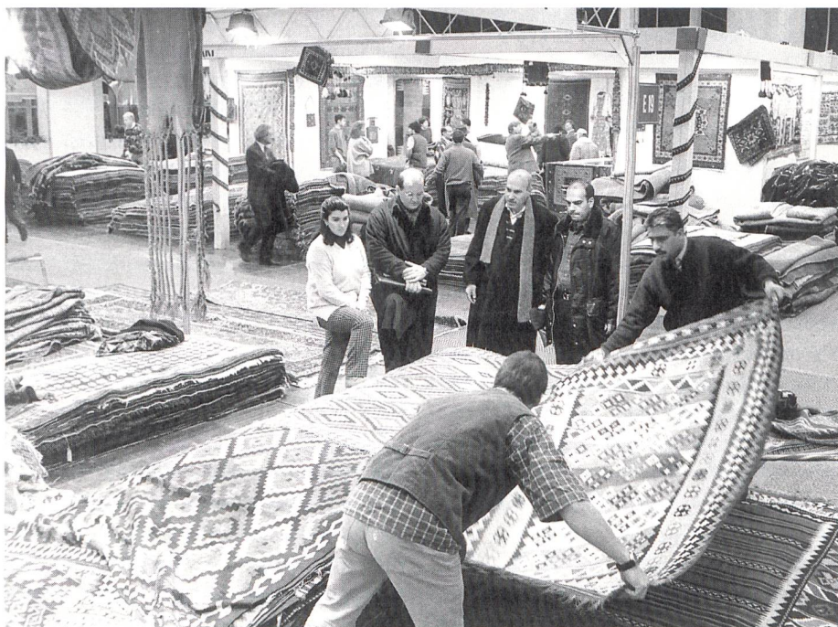
Kritische Blicke der Einkäufer

Als besonders positiv wurde das TREND HOTEL bewertet, in dem sich Fachleute aus der internationalen Hotellerie über zukünftige Hotelzimmer-Designs informieren konnten. Überzeu-