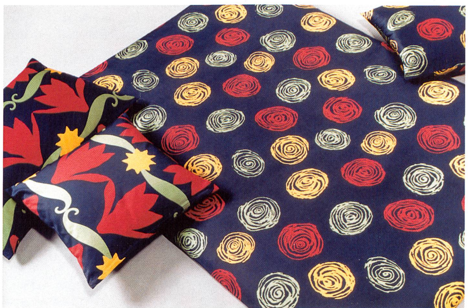
Bettwäsche aus 100% Lenzing Modal micro

Mischungen mit Leinen, Seide und Wolle sind erprobt. Modal Micro ver-