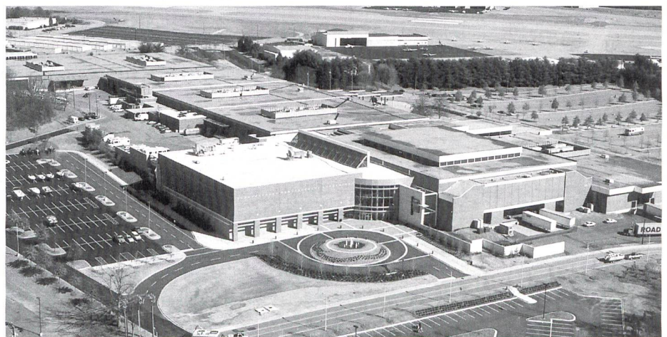
PalmettoExpo Center, Greenville, South Carolina, USA

Vom 7. bis 11. April 1997 wird in Greenville die ATME-I 97 stattfinden und wieder Tausende Fachleute aus der Textilbranche anziehen. In Vorbereitung dieses speziell für die amerikanische Textilbranche, aber auch für den europäischen Textilmaschinenbau wichtige Ereignis, berichten wir über Neuheiten aus dem Gebiet der Fadenherstellung.