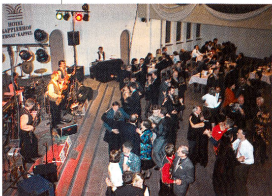
Impressionen vom Textil-Ball 1997

Open end – Verlängerung in der Weyschono-Bar