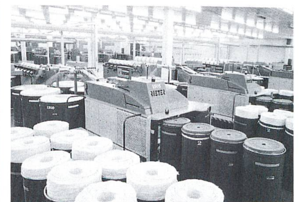
Abb. 2: Die Regulierstrecke RSB-D 30

Mit dem ComforSpin®-Verfahren setzt Rieter neue Massstäbe. Das com4®-Garn (Abb. 1) eröffnet Kunden neue Möglichkeiten in der Gestrick- und Gewebegestaltung. Es besticht durch geringe Haarigkeit, hohe Garnfestigkeit und Dehnung sowie einer deutlich verbesserten Ökobilanz in der Herstellung. Erstmals wird