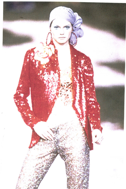
Alllover Paillettenveston von Jakob Schlaepfer, verarbeitet von Ungaro

Selbst Karl Lagerfeld hat sich wieder ganz auf «Mademoiselle» konzentriert: Softige Föminität in weichen, schmeichelnden Stoffen. Eine schmale Silhouette in gerader oder leicht hüftbetonter Linie, diente als wirkungsvolle Kulisse für all die schmückenden Accessoires, die den einzigartigen Charme von Chanel prägten: Gürtelschnallen, Broschen und mehrreihige Perlenketten.