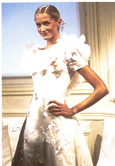
Zauberhafte Mariée von Forster Willy, verarbeitet von Hannae Mori

Dieses Manifest der Dekoration und der Freude am Schönen kommt schweizerischem