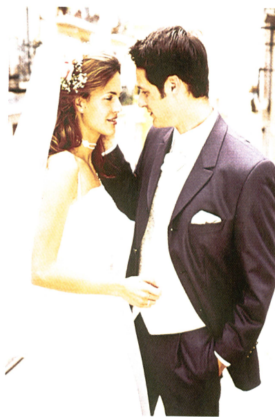
Modischer Einreiber aus der Frühjahr/Sommerkollektion 2001 der Marke Wilvorst

Bugatti ist neben Pikeur die stärkste Marke der Gruppe Brinkmann, und ist auch in der Schweiz mit einer Vertretung in Zürich ein star-