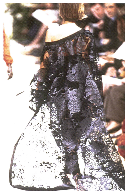
Spektakulärer Tüllmantel von Jakob Schlaepfer, verarbeitet von Balmain

Textilschaffen natürlich sehr entgegen und es erstaunt deshalb nicht, dass manche der exquisitesten Kreationen auf den Pariser Laufstegen ihren textilen Ursprung in der Schweiz hatten!