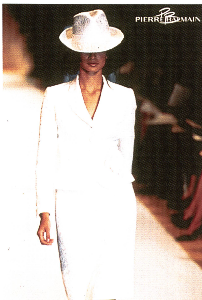
Zeitlos klassisches Tailleur von Abraham, verarbeitet von Balmain