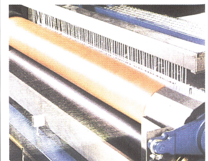
BEN-FULLSIZE - Filamentschlichtanlage mit Heisslufttrockner und Zylindertrockner

Der Einsatz des motorischen Zettelwalzenge-stells beim Vollfadenschlichten garantiert die präziseste Zugregelung bei gleichzeitig hohem Bedienkomfort. Die von Benninger bekannte