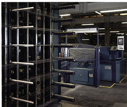
BEN-TRONIC für den universellen Einsatz

Die an der ITMA'99 als Neuigkeit vorgestellte Schärmaschine BEN-TRONIC hat sich auf dem Markt durchgesetzt. Bis heute sind mehr als 200 Schärmaschinen dieses Modells verkauft worden. Die ultramoderne Prozesssteuerung, die hervorragende Ergonomie und die bildgeführte Bedienung, garantieren eine effiziente Produktion von Webketten für allerhöchste Ansprüche.