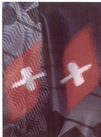
Rechts das rein auf Schnelligkeit ausgerichtete frühere Material – links das aufgrund der Kaman-Theorie entwickelte Eschler-Speziallaminat mit S-förmiger Prägung (Spiraleffekt «Votex») für mehr Sicherheit im alpinen Rennsport.

lieren Turbulenzen. Deren Verhinderung oder Verringerung machen es für den Athleten einfacher, seine Position unter Kontrolle zu halten. «Entsprechende Tests bestätigten, dass ein S-förmig um ein Objekt gewickeltes Band die Kraft der Verwirbelung und die Seitenvibration