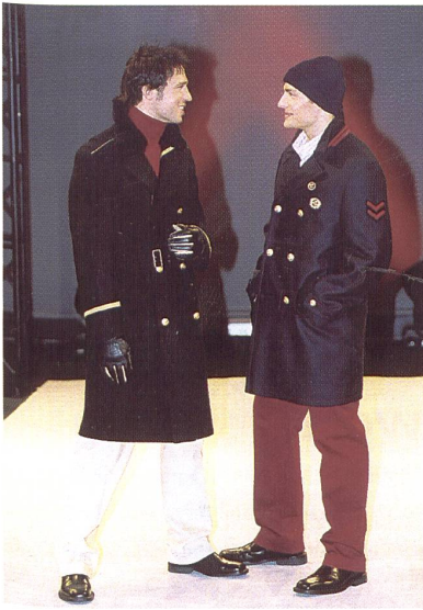
Trend on Stage 2

überlassen. Auf der einen Seite setzen sich die dekorierten bis supergeschmückten Modelle in Szene, auf der anderen Seite die kunstvoll verdeckten bis superantiken Ausführungen. Goldspritzungen, Überfärber, Spitzenapplikationen, bunte Steine, Glitzerbänder, Pailletten bis hin zu Dekorbildern à la Glanzbilder schmücken die Einen; die Anderen fühlen sich mit künstlichen Schlammgespritzern, Knautschfalten, Rissen, öligen Farbspritzern und teilweise sogar extra schiefen Nähten wohl. Modellmässig zeigt Mustang taillierte Jeansblazer mit unterschiedlichen Taschenlösungen, Jeanskleider mit Puffärmeln, gejeante kurze Cordmäntel mit Gürtel und gesmoke Blusen; Swear präsentiert einen Mantel mit Schlaufenvolants am Schalkragen; Dickies lanciert biesengeschnürte Gesässstaschen; Fubu die Workerjeans mit Muhammed Ali Konterfei; Caterpillar schliesslich propagiert Jeanshemden mit Kettelnähten. Indian Rose zeigt neben einer sehr phantasievollen Kollektion Jeans mit Ornamentdrucken sowie Kunstwerken von alten Meistern.