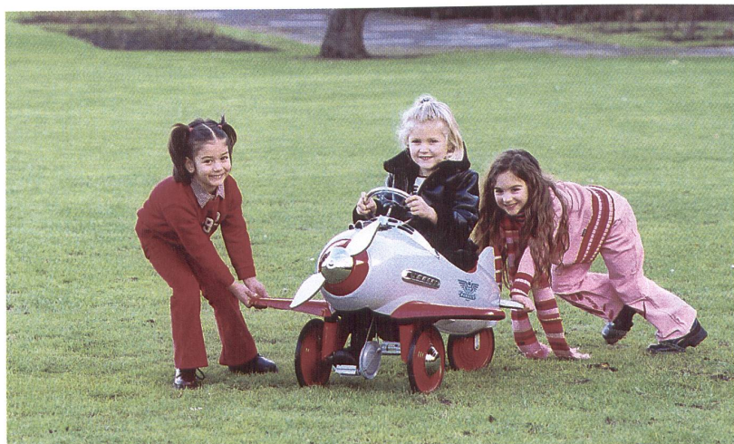
Kinder- und Jugendmode in Köln

ACHTUNG SVT-Kurs Nr. 1 Verschoben auf Freitag, 21. Juni 2002