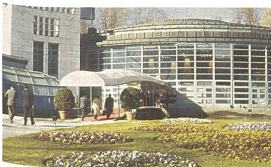
Villa Erba, Cernobbio

Die im Frühjahr stattfindende FILO, eine Messe für Garne, Fasern, Design und Veredlung von Geweben und Maschenwaren, ist in der Villa Erba in einer ausgeglichenen und von Bewusstsein gekennzeichneten Atmosphäre zu Ende gegangen. Ausgeglichenheit, begründet durch das Engagement der Aussteller und die von ihnen verbreitete Stimmung. All dies hat zum Erfolg geführt, denn die Besucher in der Villa Erba waren ein fachkundliches Publikum, und die geknüpften Kontakte, nach Aussage der Aussteller, positiv und produktiv, obwohl, wie vorausgesehen, weniger Besucher eingetroffen waren; 13,5 % Besucher aus dem Ausland, 16,9 % aus dem Inland, insgesamt – 15,2 % weniger.