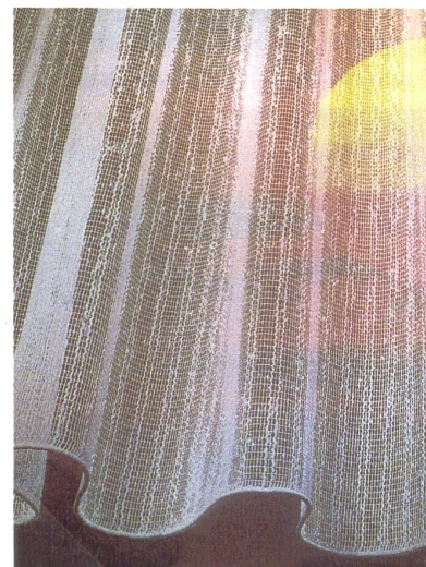
Makelloser Fall durch Bleiband

Der neu eingeschlagene Weg im Produktbereich und die Ausrichtung auf eine Marke hatte zur Folge, dass auch die Vertriebsorganisation entsprechend aufgebaut werden musste. Mit den im Textilmarkt üblichen Handelsvertretern war eine konsequente Markenartikel-Idee nicht durchzusetzen. Vertriebs erfahrene Fachkräfte wurden fest angestellt und zu Verkaufsberatern geschult. Nicht «Umsatz um jeden Preis» war das Erfolgskriterium. Wichtig war das Mitdenken in Markenartikelkategorien und beratend den Handelspartner in seinen Absatzbemühungen zu unterstützen. Gardisette wird auch heute noch nur in den Fachgeschäften des Einzelhandels, den Fachabteilungen der Warenhäuser