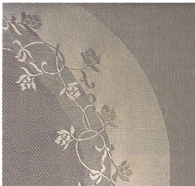
Abb. 3: In Höschchen aus dieser Rascheltronic®-Ware wird Frau auch der Glücklichermacher Nummer eins – das tägliche Stück Schokolade – verziehen: funktionale Zonen sorgen für straffe Körperformen

Gezielt elastische Zonen beispielsweise könnten für perfekte Körperformen und glatte Übergänge zur Haut sorgen. Hierfür müssten bestimmte Bereiche zusätzlich mit Elastan bestückt werden. So liessen sich Oberschenkel straffen, Bäuche glätten und Pos runden. Auch kneifende Höschchenbunde könnten der Vergangenheit angehören. Besonders weiche Garne in diesem Warenabschluss sorgen für «Softtouch» und höchsten Tragekomfort.