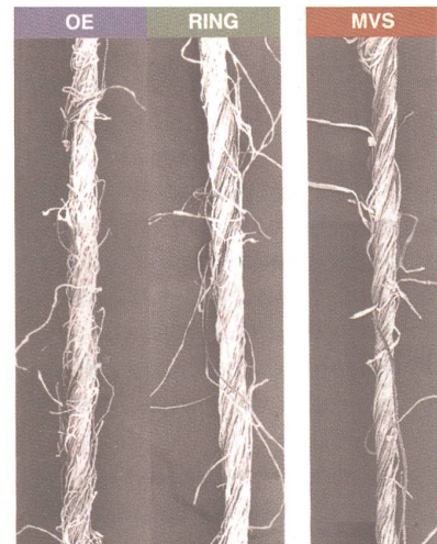
Vergleich verschiedener Garnstrukturen

Im Bereich der Qualitätssicherung werden Qualitätssicherungskonzepte erarbeitet und in die betriebliche Praxis eingeführt. Dies umfasst auch das Formulieren der Qualitätspolitik, das Erarbeiten des Qualitätshandbuchs mit allen erforderlichen, qualitätsrelevanten Daten sowie