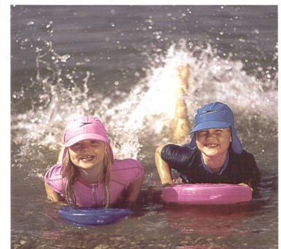
Titandioxid fängt Sonnenstrahlen ab

Das Textilforschungsinstitut Hohenstein hat den neuen UV-Standard 801 eingeführt, in dem gerade die erschwerenden Bedingungen unter Nässe und Dehnung berücksichtigt werden. Ultramid BS416N wurde vom Institut nach UV-Standard 801 ein Sonnenschutzfaktor von über 60 bescheinigt, unabhängig von Feuchte und Dehnung.