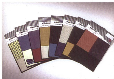
Husky von Eschler

Die Stoffe zeigen sich vornehmlich matt und natürlich, wobei seidige Lüster und Changeant-Effekte für Belebung sorgen. Innovative Ausrüstungen und Denim-Waschungen bleiben ebenso hochaktuell und unerlässlich wie