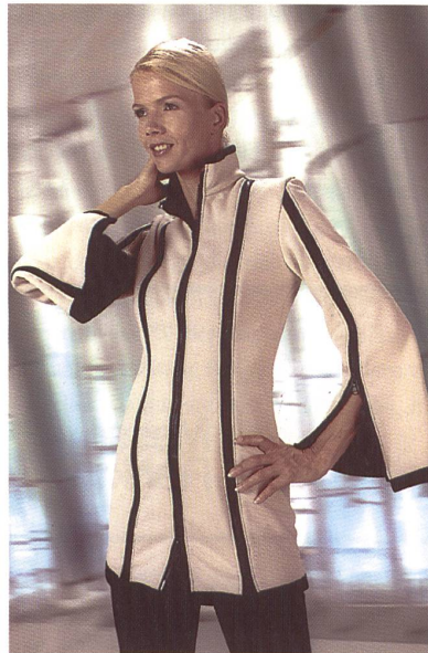
Atmungsaktiv und funktionell

Mit Trevira High Tech Faser- und Filamentgarnen können die Ansprüche an Stoffe mit einem Mehr an Funktionalität, Komfort und Qualität passgenau erreicht werden. Die neu entwickelten Trevira Bioactive Fasern erweitern die Funktionspalette und schützen wirksam gegen Mikroorganismen. Trevira Wollmischungen (Trevira Perform), feinfädig, wertig und edel im Griff, spiegeln Eleganz und Lässigkeit wider.