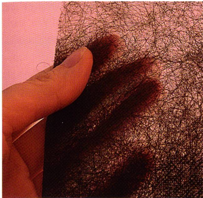
Qualitätskontrolle bei Vliesstoffen

Produktreihe MASC (Modular Algorithms for Surface Control) darüberhinaus die Systeme MASC-FOQUS (Farbanalyse und -klassifizierung) und MASC-TASQ (Qualitätskontrolle von bandförmigen Textilien) entwickelt worden. Die modulare Struktur dieser Systeme ermöglicht eine einfache Kombination mehrerer Produkte und somit eine vollständige Qualitätskontrolle.