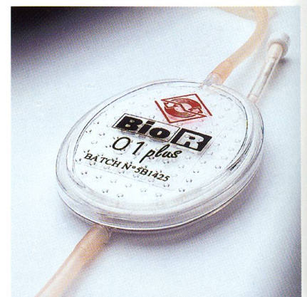
Abb. 1: Celanex PBT 2008 als Meltblown-Vliesstoff für die Blutfiltration

Neben dem vorgestellten Typ Fortron PPS 0203HS hat Ticona einen weiteren Fortron-Typen entwickelt, der speziell für den Healthcare-