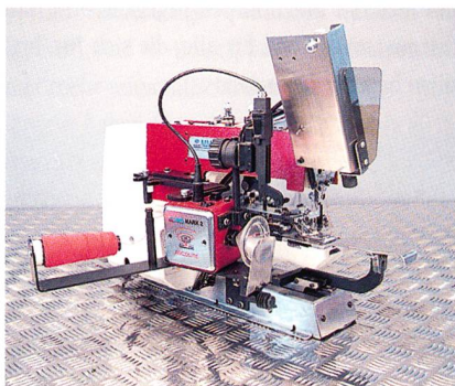
Knopfstiel Indexer Mark 12

Knöpfe befestigen und Knöpfe sichern – das ist die Zielsetzung der Firma Ascolite AG aus Erlenbach. Von jeher war es das Bestreben der Firma, der Bekleidungsindustrie die besten und rationellsten Systeme der Knopfsicherung zur Verfügung zu stellen. Seit Einführung der thermofixierbaren Knopfstielumwicklung im Jahr 1995 verwenden weltweit unzählige Mode- und Be-