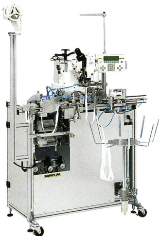
Nähautomat HS 972

Einige Nähautomaten können mit entsprechenden Übergabestellen auch zu Fertigungsketten zusammengestellt werden. So kann zum Beispiel mit dem Nähautomaten HS 972 vollautomatisch der Gummiring ab Rolle abgelängt und zusammengenäht und anschliessend an die HS C12H weiter gegeben werden, um dort eine entsprechende Etikette aufgenäht zu erhalten. Anschliessend wird der Gummiring abge-