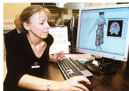
Schnittkonstruktion am Computer

Wichtiges Arbeitsmittel ist dabei eine Spritzpistole, mit welcher das Reinigungsmittel auf das Material aufgesprüht wird, und eine entsprechende Absaugung. Je nach Einsatzgebiet und Anforderung stehen verschiedene Grössen zur Verfügung. Speziell für die Bereiche Modehäuser und Hotels sind in letzter Zeit neue und kleine Fleckentfernungsstationen entwickelt worden.