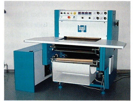
Presse PR 4 DH

Da ist beispielsweise das bügelfreie Hemd, welches wegen seiner hochausgerüsteten Oberstoffe sowohl nach speziellen Einlagestoffen, gleichzeitig aber auch nach auf die Anwendung ausgelegten Maschinen ruft. Freudenberg Gygli geht aber darüber hinaus und bietet auch Fi-