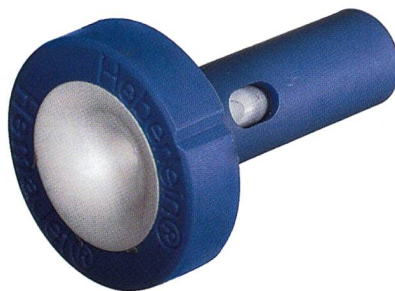
HemaJet® Düsenkern T 311-2 K2 (L)

Die Serie A ist jedoch auf Grund der deutlich höheren Luftstromgeschwindigkeit wesentlich flexibler bezüglich Filamentfeinheit und Materialdichte (z.B. Polypropylen).