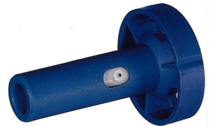
HemaJet® Düsenkern T 311-2 K2 (R)

Variante 2: Mitteltitergarn für Sport- und Freizeitbekleidung