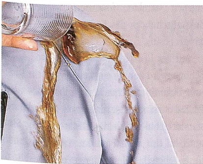
Abb. 1: NanoSphere®

Vorgängig zu dieser Berichterstattung möchte der Chronist auf den in der «mittex» 5/2004 erschienenen Artikel über innovative Oberflächenbehandlungen von Geweben hinweisen. Unsere Mittextiler bei Schoeller Textil AG erhielten in diesem Jahr wiederum mehrere Auszeichnungen und Awards für ihre Forschung, Entwicklung und das Design von unkonventionellen und kreativen Textilien. Folgen wir deshalb dem chinesischen Sprichwort «lieber 1 Mal sehen als 1'000 Mal hören» mit Abb. 1 (NanoSphere®). Wer von uns befand sich nicht auch schon in einer ähnlichen Situation – bewusst oder unbewusst?