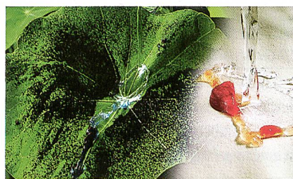
Abb. 3: Lotusblatt-Effekt

Die Natur macht es uns vor. Blätter bestimmter Pflanzen bleiben immer sauber, weil Schmutz auf ihren fein strukturierten Oberflächen nicht haften kann und dieser bei Regen sehr leicht abgewaschen wird. In der von Schoeller entwickelten NanoSphere® Technik ist dieser natürliche Antihaft- und Reinigungsprozess, die sogenannte Selbstreinigung, auf die Textiloberfläche übertragen worden. Abb. 3 zeigt die Oberfläche eines Lotusblattes im Nano-Bereich.