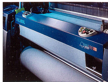
Die neue OMNIplus 800

Alle Maschinenteile sind optimiert für bisher ungekannte industrielle Maschinendrehzahlen, minimalen Unterhalt und maximale Rentabilität. Darüber hinaus ist die OMNIplus 800 randvoll mit Funktionalitäten, die die Realisation von bester Gewebequalität vereinfachen.