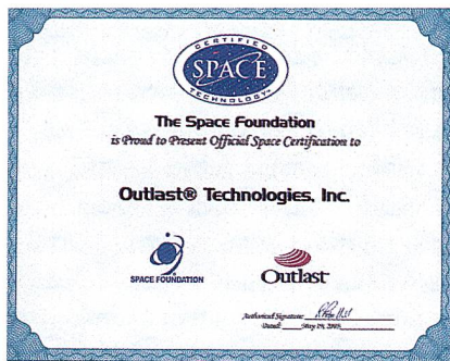
Abb. 9: Im Mai 2003 wurde Outlast mit dem renommierten Gütesiegel «Certified Space Technology» ausgezeichnet.

for Steady State and Dynamic Thermal Performance in Textile Materials)» ASTM D7024 verabschiedet. So kann erstmals die Menge latenter Energie in textilen Materialien gemessen werden. Die ASTM International ( www.astm.com ), West Conshohocken (PA)/USA, wurde 1898 gegründet und ist einer der grössten Normierungsausschüsse weltweit – damit eine verlässliche Quelle für technische Normen für Materialien, Produkte, Systeme und Dienstleistungen (Abb. 9).