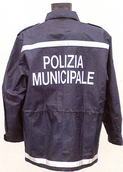
Abb. 7: Die Stadtpolizei in Rom trägt Temperatur ausgleichende Jacken, die mit dem intelligenten Material Outlast® Adaptive Comfort® gefüttert sind.

Neben dem primären Ziel von Outlast®-Materialien, Temperaturschwankungen auszugleichen, war für Frontline eine weitere, essenzielle Überlegung bei der Auswahl wichtig: die relative Kontrolle der sogenannten Dochtwirkung durch Outlast®-Materialien. Durch Körperwärme wird Schweiß gebildet. Gewöhnlich wird an intelligente Materialien die Anforderung gestellt, Schweiß vom Körper, von der Haut weg zu transportieren und die Feuchtigkeit verdunsten zu lassen. Im Zusammenhang mit CBRN-Bekleidung jedoch lautet die Aufgabenstellung völlig anders. Die schützende Lage, die wiederum auf der ersten Lage aufliegt, besteht aus einer speziellen Karbon-Beschichtung, die vor flüssigen Chemikalien sowie Kontaminationen durch Dampf und feste Partikel schützen soll. Es hätte definitiv negative Auswirkungen, würde übermässig viel Schweiß auf diese Lage treffen (wie dies bei konventionellen intelligenten Materialien der Fall ist, da die Feuchtigkeit transportiert wird). So würde Karbon zum Beispiel die Feuchtigkeit absorbieren, wodurch die Wirkungsweise beeinträchtigt werden würde.