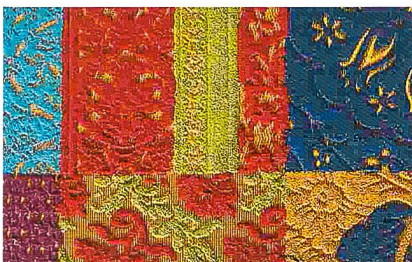
Abb. 1: Samtmuster