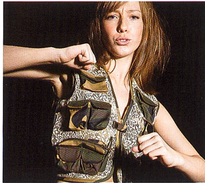
Abb. 1: Das passende Supergirl-Dress

Welche Frau möchte nicht einmal gern Lara Croft sein, um sich mit ebenso eisernem Willen wie gestähltem Körper einfach zu nehmen, was ihr zuzustehen scheint – besonders im heiss umkämpften Terrain rund ums spannungsgeladene Miteinander der Geschlechter. Untenstehend findet sich das passende Supergirl-Dress