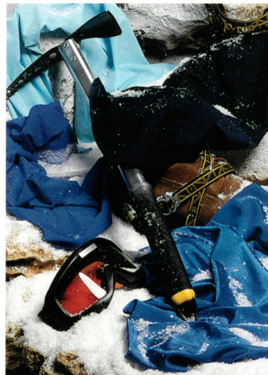
Abb. 2: Impact: Himmel Blau: H-350 - SAE LIM - SCP153P, Blau: H-250 - SITIP - FLASH, Blau: H-250 - FUJIAN K BOXING - N05009, Navy Blau: H-350 - PUCHEON - TCF003

Bei Extrem-Sportlern kommt es auf Bewegungsfreiheit, Komfort und vor allem Schutz an. Die creora Elastan/Spandexfasern ermöglichen die Herstellung leichtgewichtiger und schützender Hochleistungsfasern. Hochmodulare Fasergelege ermöglichen in Verbindung mit creora performance H-350 und creora black H-100D ein lang anhaltendes Schwarz und dunkle Farben (Abb. 2).