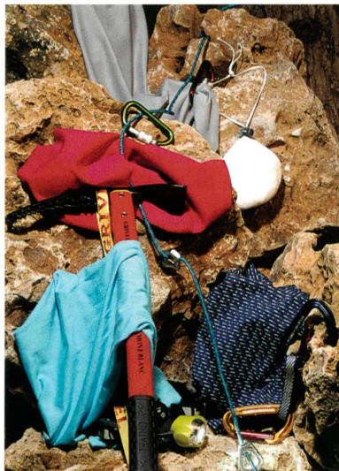
Abb. 1: Intelligent Action: Grau: H-350-PUCHEON-NATWY 250, Rot: KAD149-Hyosung-Aerowarm® 65/72F, Blau: H-250-YISETEX-YSH-1485, Navy Streifen: H-350-ECLAT-R60508082

Die Highlights: creora performance H-350, das in Mischungen mit Polyester und Bambuskohle Verwendung finden kann, und creora