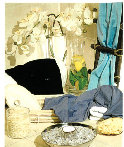
Abb. 3: Comfort Zone: Eine wichtige Komponente ist das energieeffiziente creora eco H-450/C-400

creora eco H-450/C-400. Ökologisch nachhaltige Stoffe entstehen aus Mischungen von creora eco mit nachhaltigen Fasern wie Bambus, Soja, Holz, Milch sowie Zellulose von Modal und Tencel. Eine Methode zum Strukturieren von Jersey bringt Stoffe mit körnigem, unverfälscht natürlichem Touch hervor. Mikro-Struktur-Effekte in Garnen, Mélange-Mischungen und Mélangegefärbte Effektgarne verleihen dem Stoff eine optische Struktur. Diese Entwicklungen sind ideal für Spa- und Yogabekleidung sowie softe Activewear, die in Richtung Homewear geht (Abb. 3).