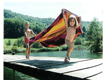
Abb. 1: Nur mit modernsten Webmaschinen ist die wirtschaftliche Herstellung hochwertiger und exklusiver Frottiertgewebe möglich

Das wesentliche Qualitätsmerkmal für Frottiertgewebe ist der Schlingenflor, welcher das Volumen und den Griff mitbestimmt. Ausschlaggebend sind das Schlingenbild, die Gleichmässigkeit der Florhöhe, die exakte Ausbildung von Musterkonturen sowie der Übergang von Glatt- zu Florgewebe und umgekehrt. In diesem Prozess nimmt die Webmaschine eine zentrale Stellung ein. Durch die Kombination modernster Antriebs- und Steuerungstechnik mit raffinierter Frottier-Bindungstechnik wird die Sulzer Textil Greiferwebmaschine G6500F den hohen Ansprüchen an die modische Vielfalt, Qualität und Produktivität vollumfänglich gerecht.