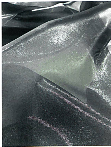
Abb. 5: Nanometall-beschichteter Vorhangstoff MASA aus Trevira CS von Suzutora Corporation, Japan (Kollektion: TORA-JU)

klassischen Sonnenschutz oder als moderner Raumteiler, werden durch Verwendung unterschiedlicher flammhemmender Trevira Garnen sowie den möglichen Einsatz von Trevira CS Effektgarnen noch potenziert.