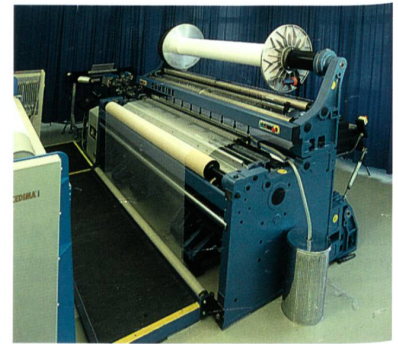
Abb. 2: Wasserdüsenwebmaschine CAMEL W

Die Maschine kann mit einem zweiten Kettbaum ausgerüstet werden. Dadurch lässt sich das Gewebesortiment wesentlich erweitern. Es können Kettfäden aus verschiedenen Rohmaterialien und/oder mit verschiedener Einarbeitung verarbeitet werden. Der zweite Kettbaum wird mit einem separaten Servomotor angetrieben. Damit können die freizugebende Kettfadlänge und die Werte für die Kettfadenzugkraft individuell eingestellt werden. Das Resultat sind Gewebe mit unterschiedlicher Optik und Qualität.