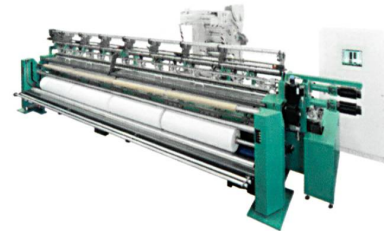
Abb. 3: RS 2 EL-F und RS 3 EL-F für die Herstellung von Verpackungsnetzen

Maschine umsetzen können – ohne die aufwändige iterative Kooperation mit KARL MAYER bei der Erstellung der benötigten Musterscheiben. Mit dem neuen, in KAMCOS® integrierten Muster-Editor wird das Muster direkt am Operator Interface unkompliziert eingegeben, bei verminderter Drehzahl gearbeitet und ebenso einfach an die Wünsche des Kunden angepasst (Abb. 3).