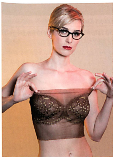
Abb. 2: Die TL 43/1/24 erfüllt die Wünsche der Damenwelt

TL 31/1/24 und TL 66/1/24 emanzipiertes Leistungsportfolio für die effiziente Produktion konfektionsoptimierter Qualitäten. Die Eckpunkte des Erfolgskonzepts dabei: Drehzahlen von bis zu 600 min -1 und gleichzeitig eine weit reichende Musterungsvielfalt durch 14 Musterlegebarren hinter dem Fallblech sowie Versatzwege von bis zu 170 Nadeln. Damit holt die neue Textronic®Lace grazil gestaltete Sterne vom Himmel und platziert sie in dichter Schar auf einem zarten ornamentalen Grund. Freistehend und mit gelblicher Unterlegung funkeln die gezackten Musterspots in bewegtem Ambiente in