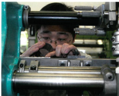
Abb. 4: Das Ausbildungs- und Trainingszentrum

Mit der Eröffnung der neuen Produktionsstätte KARL MAYER (CHINA) Ltd. gibt es nun auch in China eine KARL MAYER Academy. Das Ausbildungs- und Trainingszentrum für den asiatischen Raum gehört zur KARL MAYER China Ltd. und hat verschiedene, spezifische Wirkereikurse im Programm (Abb. 4). Die Lehr-