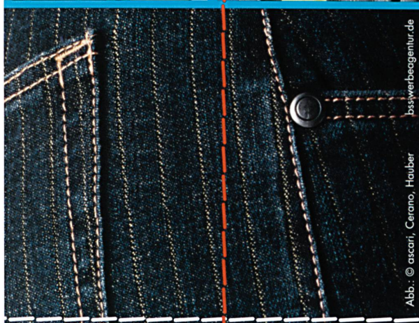
Abb.: © ascari, Cerano, Hauber bsswerbeagentur.de