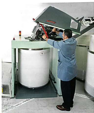
Abb. 3: Gute Zugänglichkeit erleichtert Bedien- und Wartungsarbeiten

Bei der SB-D 11 kommen die gleichen Oberwalzen und Drehteller zum Einsatz wie an der (R) SB-D 40. Dies erhöht die Flexibilität und senkt die Kosten für die Lagerhaltung. Aufgrund der Kompaktheit besteht die SB-D 11 durch eine gute Zugänglichkeit. Dadurch lassen sich Bedien-, Einstell- und Wartungsarbeiten einfach und rasch durchführen (Abb. 3). Zudem erlaubt