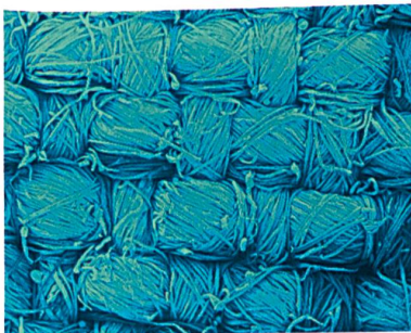
Abb. 1: Gewebe mit kritischen Faserenden

Für die mechanische Irritation der Haut können ganz unterschiedliche kritische Beanspruchungen in der Interaktion Textil/Haut verantwortlich sein. Man muss unterscheiden zwischen punktförmigem Stechen durch einzelne Faserenden, Reiben – ob punkt-, linien- oder flächenförmig – und einer Krafteinkopplung von aussen, beispielsweise über fest anhaftende, elastische Flächen (Träger etc.) (Abb. 1).